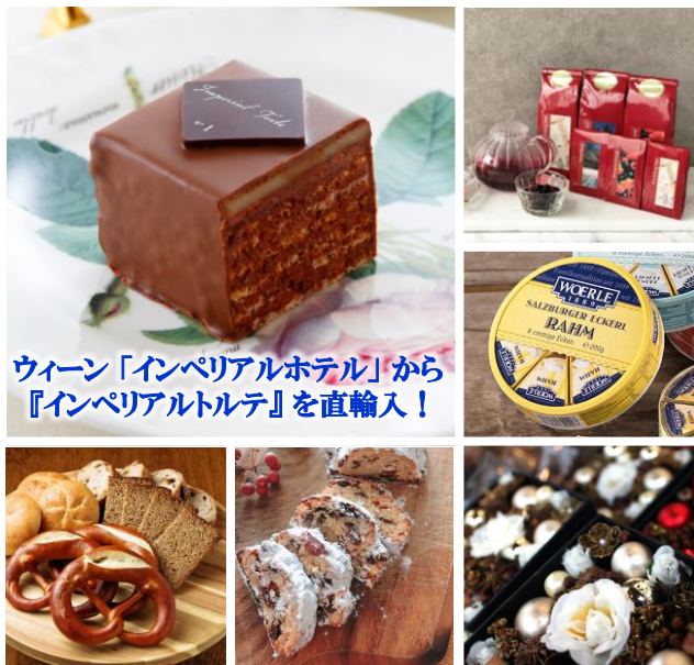
ウィーン「インペリアルホテル」から『インペリアルトルテ』を直輸入！

厳選したオーストリア直輸入の食品・ワインに加えて、クリスマスオーナメントをはじめとする雑貨類も豊富に取り揃えております。 ウィーン「インペリアルホテル」から 銘菓『インペリアルトルテ』、「Julius Meinl」（ユリウス マインル）のオリジナルコーヒー、「Haas & Haas」（ハース&ハース）の紅茶等、またザルツブルクRasp社よりスパイスオーナメントを直輸入。 ウィーンのクリスマスマーケットの雰囲気是非お楽しみください。 ※輸入商品のため、数に限りがございます、また内容が変更になる場合もございます。ご了承ください。